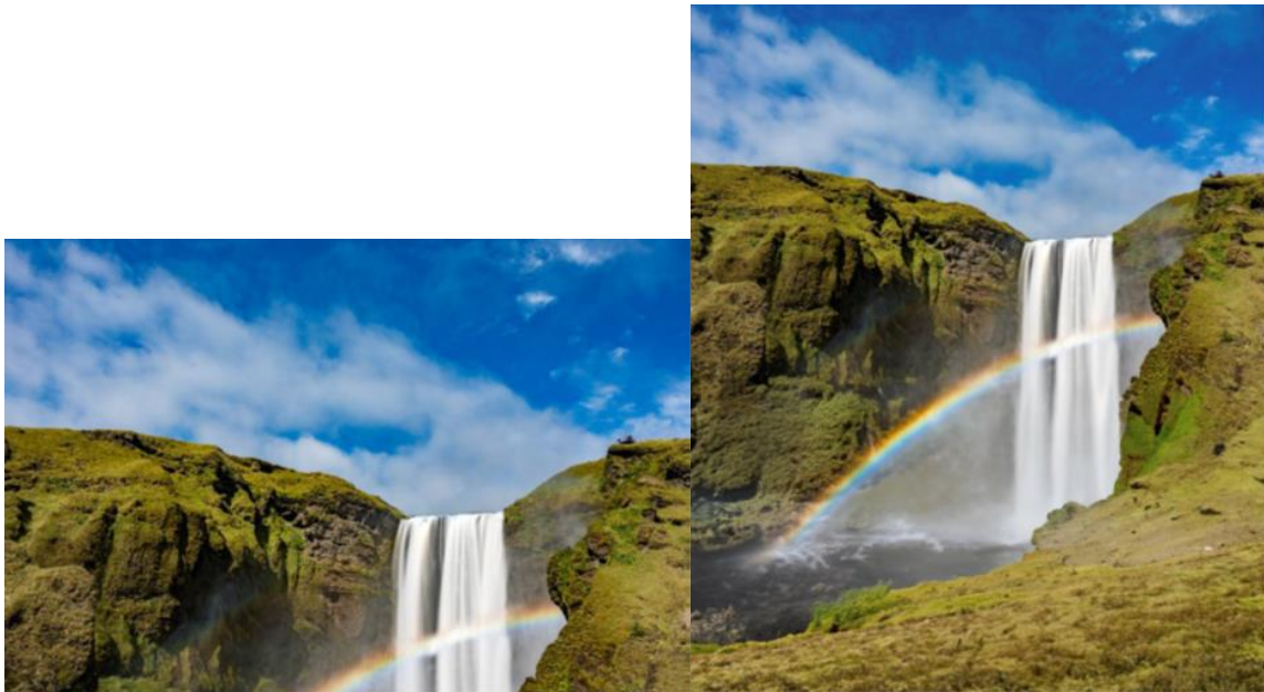
生成式擴展使用前 (左) 與使用後 (右)

生成式擴展讓用戶能使用裁切工具無縫延伸圖像。若您的主體被切掉、影像長寬比不符合需求、或對焦物件和其他部分不協調，即可使用生成式擴展輕鬆延伸畫布，讓圖像完美呈現符合您所期待的效果。