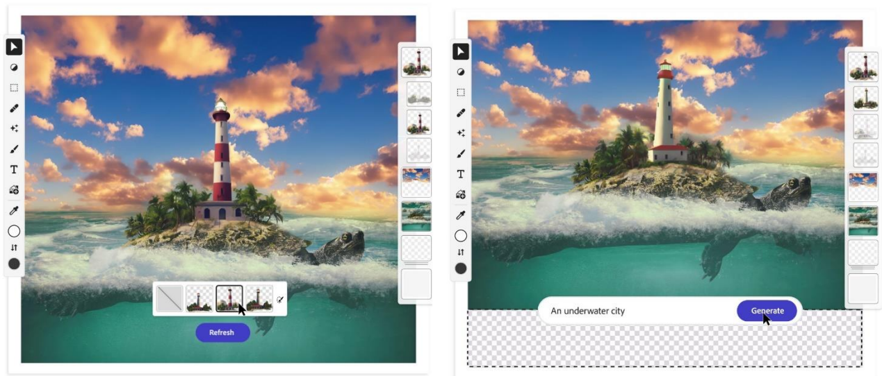
圖一、Adobe 正在設計的 Firefly 賦予所有創作者「超能力」，讓他們能夠以想像的速度工作。

Firefly 將由多個模型組成，專為具廣泛技能和技術背景的客戶提供服務，適用於不同的應用場景。Adobe 的第一個模型由 Adobe Stock 素材庫、公開許可內容和版權已過期的公共領域內容訓練，將專注於圖像和文字效果，旨在生成可安全用於商業用途的內容。Adobe Stock 擁有數以億計的專業級且獲許可的圖像，是市場上質量最高的圖像庫之一，有助確保 Firefly 不會根據其他人或品牌的 IP 生成內容。未來的 Firefly 模型將運用來自 Adobe 和其他公司的各種資產、技術和培訓數據。在發展其他模型時，Adobe 將繼續應對潛在的不良偏見。