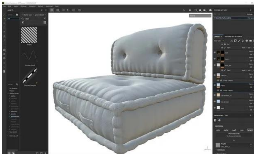
圖二：Adobe Substance 3D Designer 除了可以及時調整材質並改變顏色，還可以將作品素材直接拖入 Adobe Substance 3D Painter 中用於添加紋理和著色，賦予 3D 資產活力。

亞馬遜的設計師們正在透過 Adobe Substance 3D Designer 創造複雜的圖案和可平鋪紋理。除了可以及時調整材質並改變顏色，在幾分鐘內創造新的變化外，還可以將作品素材直接拖入 Adobe Substance 3D Painter 中用於添加紋理和著色，賦予 3D 資產活力。