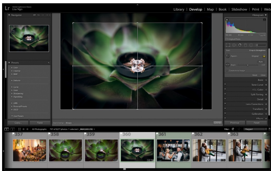
圖 3：當使用方形裁切或期望將焦點集中至相片的中心位置時，這項居中剪裁覆蓋的新功能特別有用。

剪裁覆蓋是確保相片構圖正確的有效方法。當使用方形裁切或期望將焦點集中至相片的中心位置時，這項新功能特別有用。